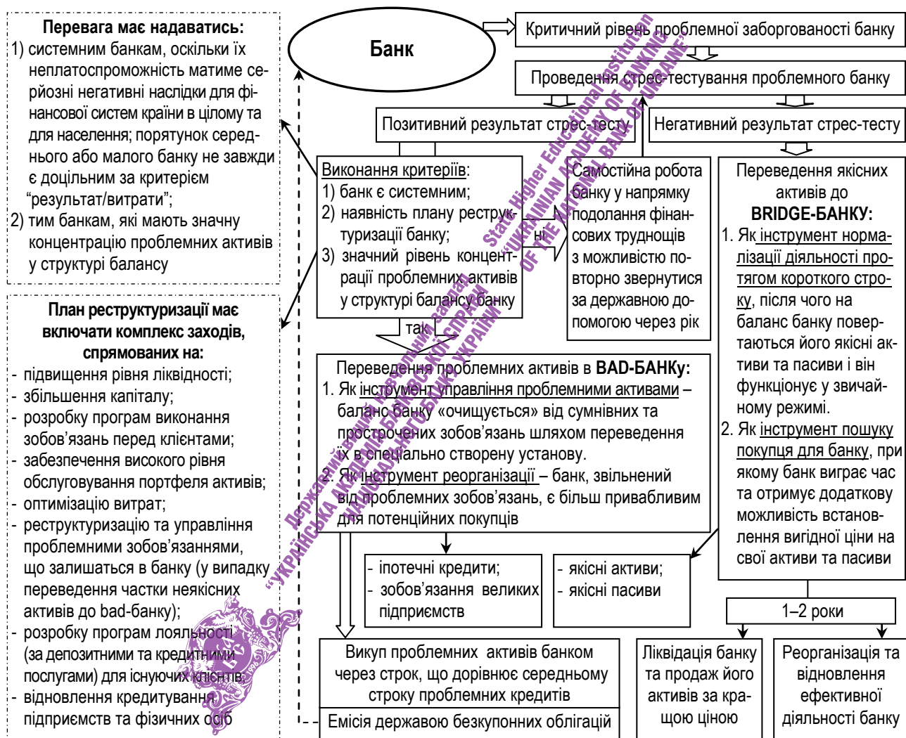
Рис. 2. Концептуальні засади управління проблемними активами банків в Україні

На відміну від існуючих, він: 1) передбачає одночасне, а не альтернативне функціонування bad- та bridge-банків у країні; 2) формалізує систему критеріїв переведення проблемних активів до даних установ; 3) передбачає надання допомоги всім банкам, що відповідають розробленим критеріям, а не тільки державним, як це передбачається концепцією створення санаційного банку в Україні; 4) знижує частоту застосування таких інструментів державного антикризового регулювання, як рефінансування та рекапіталізація; 5) знижує рівень навантаження на державний бюджет та дозволяє уникнути перекладання відповідальності за прорахунки керівництва проблемного банку на госпітальний/перехідний банк.